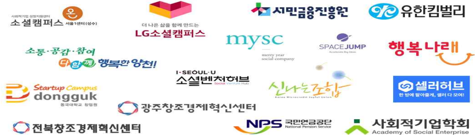
사단법인 피피엘이 보유하고 있는 창업지원 자원 현황